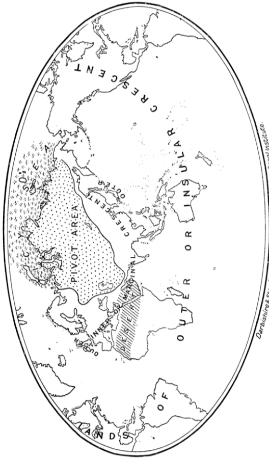
THE NATURAL SEATS OF POWER. Outer crescent—wholly oceanic. Inner crescent—partly continental, partly oceanic. Pivot area—wholly continental. Outer crescent—wholly oceanic. Inner crescent—partly continental, partly oceanic.